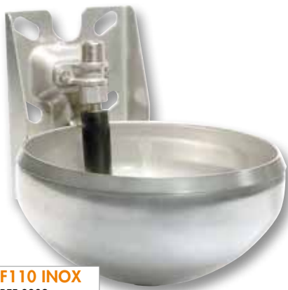
F110 INOX REF 3209

Die Tränken F110 und F130 werden seit mehr als zehn Jahren von Züchtern geschätzt. Aber bei ihrer ständigen Suche nach Lösungen, die auf die Bedürfnisse der Tierzuchtbetrieben abgestimmt sind, haben die Forschungs- und Entwicklungsteams von LA BUVETTE sich die Anliegen der Züchter angehört, um ein neues Design für diese zwei bestehenden Tränken zu entwickeln, das den Nutzen für die Züchter und ihre Tiere erhöht.