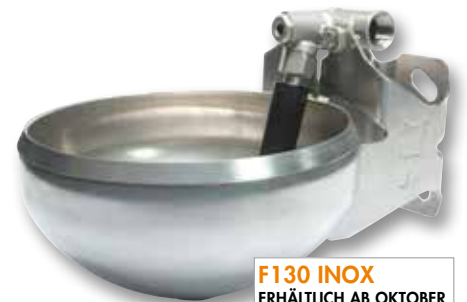
F130 INOX ERHÄLTlich AB OKTOBER 2016 - REF 3217

Beachten Sie, dass die Tränke F110 Inox weiterhin von oben mit der Wasserversorgung verbunden ist, während die Tränke F130 Inox einen Wasseranschluss aus mehreren Richtungen erlaubt. Sie kann zusammen mit Frostschutz-Kreislaufanlagen, die mit SPEEDFLOW oder einer anderen Pumpe ausgestattet sind, verwendet werden. Mit diesen