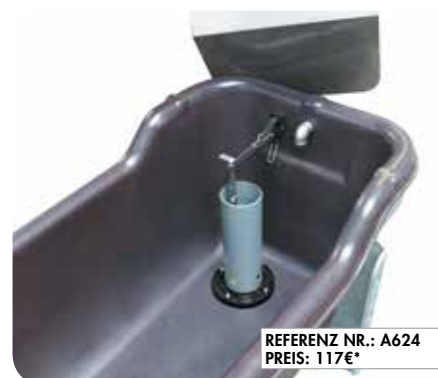
REFERENZ NR.: A624 PREIS: 117€*

vom Milchvorkühler aufgebraucht haben, empfiehlt LA BUVETTE die Ausstattung von DAIRY-BAC 400 mit einem Ventil, das an das Wasserversorgungsnetz angeschlossen ist, um die Tränke bei sinkendem Wasserstand zu befüllen. Das höhenverstellbare Schwimmerventil kann so eingestellt werden, dass ein Wasservorrat von 140 bis 220 Litern aufrechterhalten wird. Auf diese Weise wird aus DAIRY-BAC 400 eine Wassertränke mit hoher Kapazität, aus der 5 Milchkühe zu jeder Tageszeit gleichzeitig trinken können.